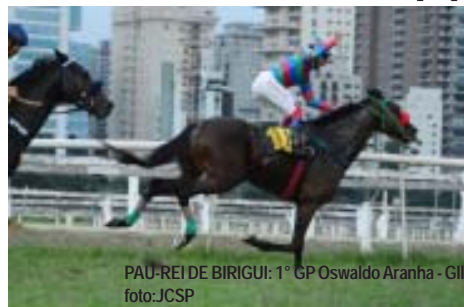
PAU-REI DE BIRIGUI: 1º GP Oswaldo Aranha - GII

Lote 04, PAU-REI DE BIRIGUI , filho do clássico Roderic O'Connor em Vila Real por Shudanz . Cavallo de 3 anos, ganhador de 3 corridas e 3 colocações, em 7 saídas, inclusive GP Oswaldo Aranha - GII. Será inscrito no GP São Paulo - G1. Potro correrá com 55 kg. Sua mãe é irmã materna de ULTINOV [G1]