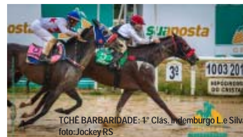
TCHÊ BARBARIDADE: 1º Clás. Indemburgo L. e Silva

O lote 06, TCHÊ BARBARIDADE filho de Elusive Quality na ganhadora de G1 Vacilação por Roy . Cavallo ganhador clássico com 8 vitórias (3 clássicas), Cristal, Gávea e Cjardim, inclusive Clás. Indemburgo d Lima e Silva, etc.. Linha feminina de LIFE SO SALE [G1], FARENHEIT [GII], NÍTIDO [G1], EXTERMINADORA [GIII], etc.