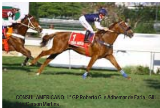
CONSUL AMERICANO: 1º GP Roberto G. e Adhemar de Faria - GIII

CONSUL AMERICAN , lote 16, filho de First American em Inselberg por Yagli . Cavallo com 12 vitórias (10 C. Jardim e 2 Gávea, e 13 colocações em 27 saídas), sendo 6 clássicas. Possui a melhor Pontuação de Rating entre Animais clássicos em atividade no Brasil. Será inscrito no GP ABCPCC - G1. Favorito