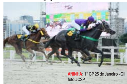
ANINHA: 1º GP 25 de Janeiro - GII

ANINHA , lote 10, filha de Impression na clássica Sunshine Indy , por P.T. Indy . Com 2 vitórias clássicas em C. Jardim, incl. Clás. 25 de Janeiro - GII; vem de 5º em 25/03. Linha materna IN SUNSHINE [GII], INSTINTO SELVAGEM [GIII], GOLPE BAIXO [GII], LA RASCASSE [G1], IXQUENTA [GIII]. Será inscrita no Delegações Turfísticas em 2200mts