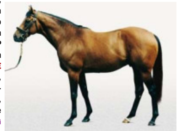
REFUSE TO BEND

NOSSO MAESTRO , lote 200, m. 20.07, filho de Refuse To Bend (US$ 1,350,034 em premios, pai de 301 ganhadores de 858 corridos) em Rapsódia Arumba , por Hibernian Rhapsody . Linha feminina de JARUMBA [GP Fábio da Silva Prado - G2], OJOTABE [GP Antonio Sa Silva Prado - G2], NETO JOE [GP Linneo de Paula Machado - G1], OUTRA ARUMBA [GP Diana - G1], DONO DA RAIÁ [GP Brasil - G1], etc.