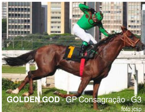
GOLDEN GOD - GP Consagração - G3