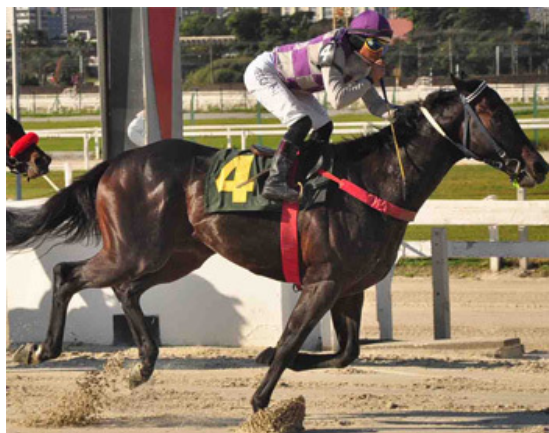
JOKENPO - GP Adil - G3

Lote 01, JOKEMASTER , filho de Yagli em Joking Aside , por Midnight Tiger . Cavalo com 1 vitória e 9 colocações (4 placês), em 13 saídas. Vem de 2* em 30.10 e 2* em 05.10. Irmão do ganhador clássica JOKENPO (GP Pres. do Jockey Vlub - GIII). Linha feminina de ACREDITADO [GIII], JOLLY MELODY [GII].